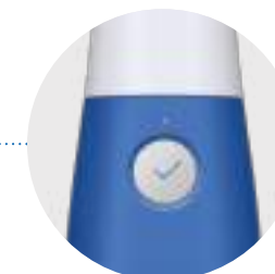
Pulsante di avvio della scansione